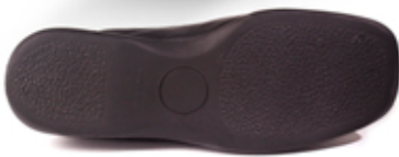
[ Contactel 24/his ]