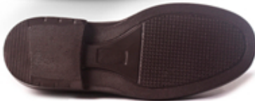
[ 3010 liso ]