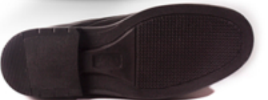
[ perforado ]