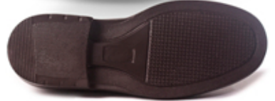
[ 3010 puntual ]