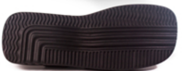
[ 2005 cerrado ]