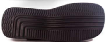
[ cruzado ]