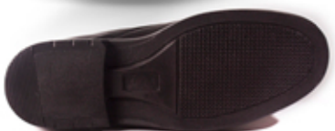
[ contactel ]

■ ■ ●●●●● Talla: 25 al 29 con medios num.