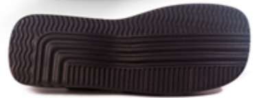
[ huarache 2005 ]