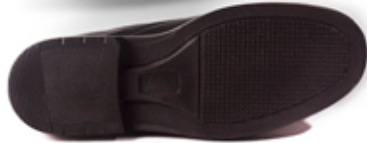
[ bota cierre ]